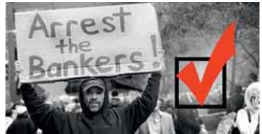
Kuva: Pidättäkää pankkiirit.