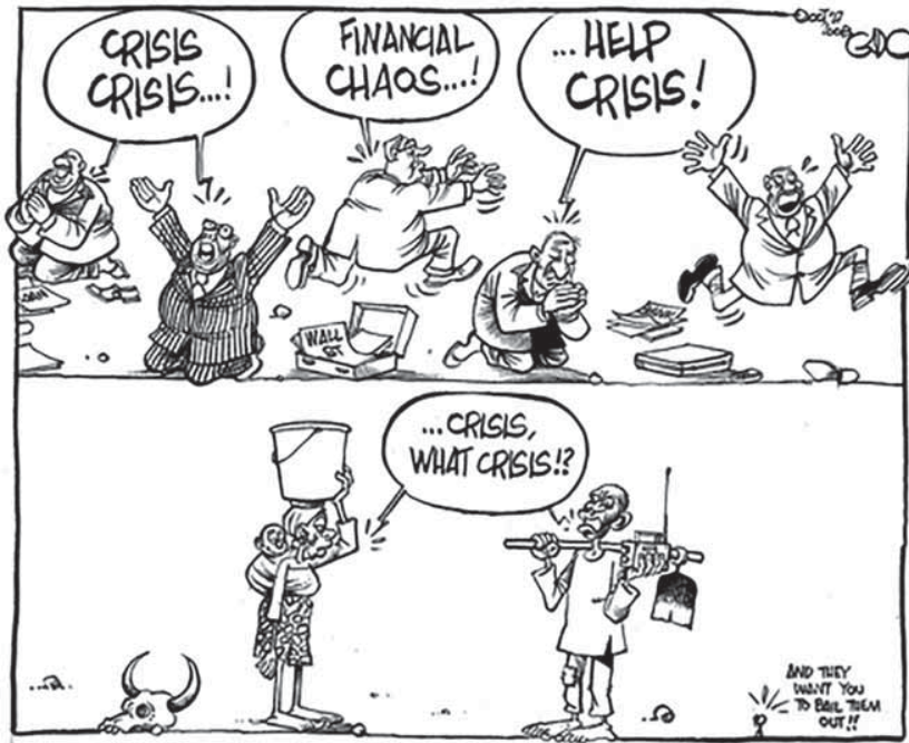
Kuva: Taloudellisesti kehittyvässä maassa, jotka tarkoittaa aikehittynyttä maata, voidaan hyvin kysyä, kriisi, mikä kriisi?

ja erityisesti suomalaisten perusoikeuksiin. Nimittäin Eta-säännökset – liiki kaikentasoiset, mm. pöytäkirjan liitteet – saavat tässä lakipaketissa olevan voimaanpanolain perusteella hyvin korostetun aseman. Jokainen suomalainen, joka soveltaa suomalaista lakia, siis viranomainen, joka tehtävästä riippumatta soveltaa suomalaista lakia, on nimittäin velvollinen olemaan soveltamatta sitä, jos se on ristiriidassa jonkun asteisen Eta-sopimukseen sisältyvän säännöksen kanssa, mm. pöytäkirjan liitteiden kanssa.”