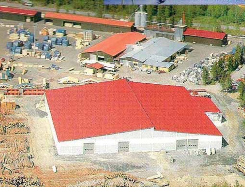
Kuva: Menestyneistä yrittäjistä tulikin syrjittyjä työttömiä.