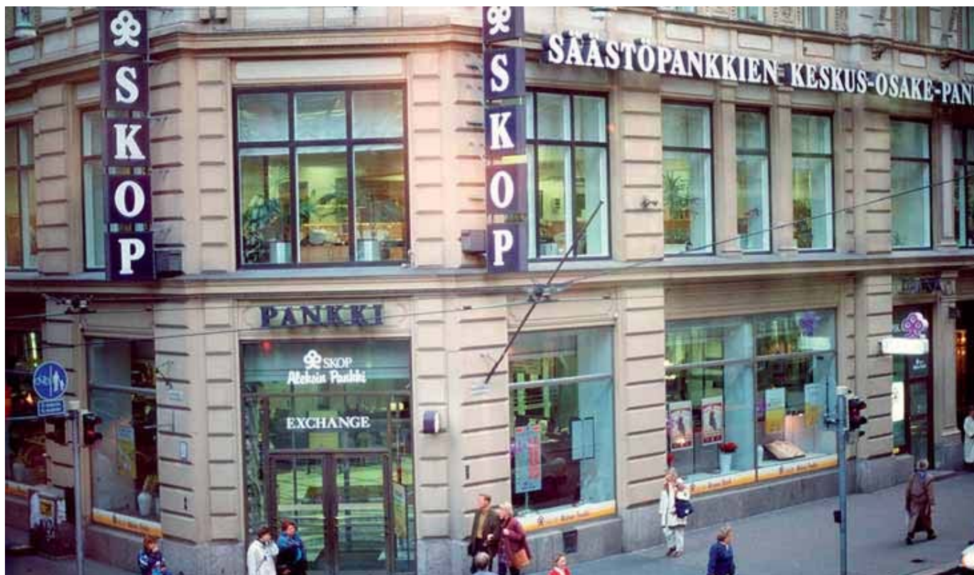
Kuva: SKOP:sta tehtiin yksi pääsyylinen, vaikka kaikki liikepankit olivat konkurssikypsiä.