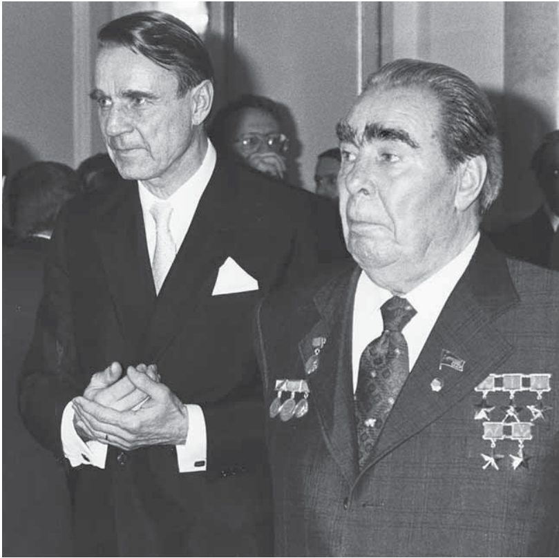
Kuva: Presidentti Mauno Koivisto ja Neuvostoliiton presidentti Leonid Brezhnev. Iltalehdessä oli juttu, jonka mukaan Koivisto oli KGB:n narussa.