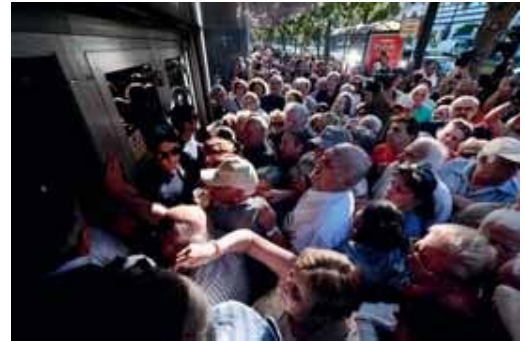
Kuva: Kreikan pankkikriisi. / www.libertyupward.com