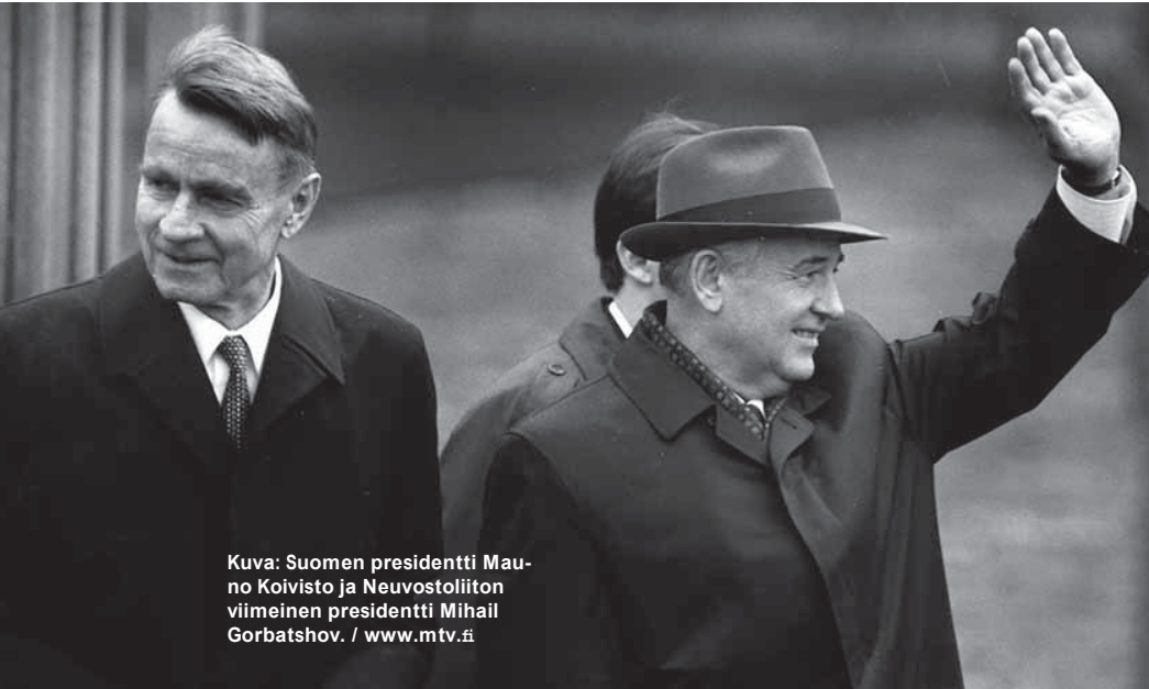
Kuva: Suomen presidentti Mauno Koivisto ja Neuvostoliiton viimeinen presidentti Mihail Gorbatshov.

valmistelu alkoi säästölain hyväksymisellä eduskunnassa 17.01.1992 ilman, että eduskunta tiesi, mitä lailla tehdään - tuhoaan Hallitusmuodon 2 §.