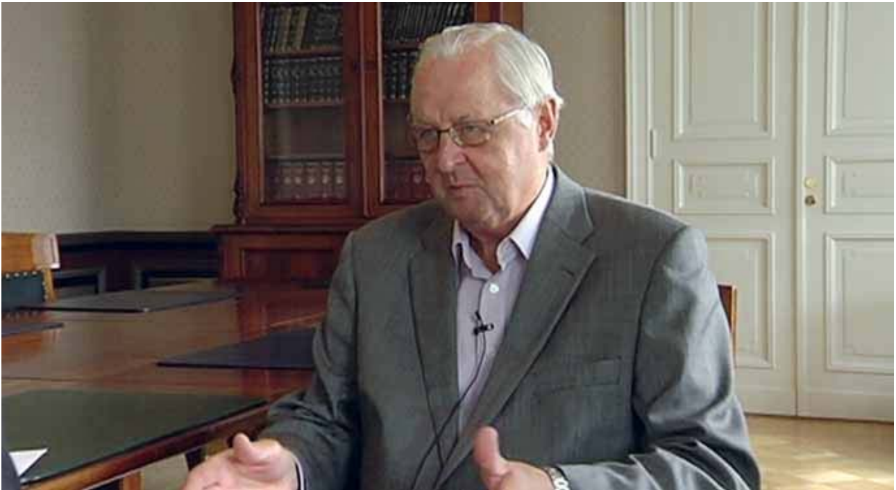
Kuva: Korkeimman oikeuden presidentti Olavi Heinonen.

Heinonen keskustelisi puheenvuoron käyttäjien kanssa sisältökysymyksistä, jotta kokonaisuus vastaisi parhaalla mahdollisella tavalla Tasavallan Presidentin toivomuksia”.